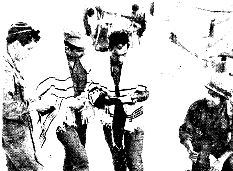
תפילת שחרית במוצב צה"ל ליד התעלה