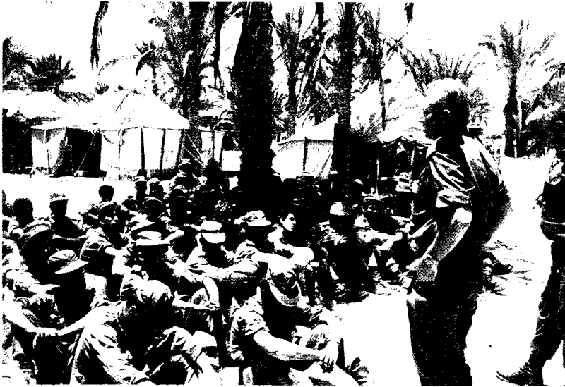
הרמטכ"ל רביאלוף חיים ברילב. נפגש עם חיילי צה"ל בתעלה

התעלה גם בגבולות עם ירדן, סוריה ולבנון. השם "מלחמת אלף הימים" (למען הדיוק: אלף מאה ארבעים ואחד יום), מהם קרוב לשש־מאות ימי מלחמת־ההתשה עם מצרים.